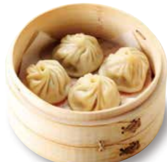
蒸小籠包 [4コ] ¥580