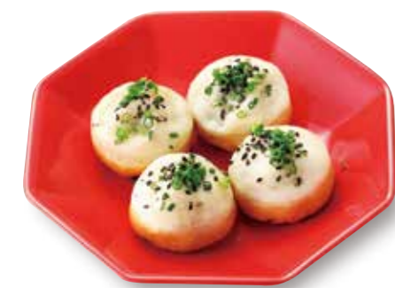
焼小籠包 [4コ] ¥580